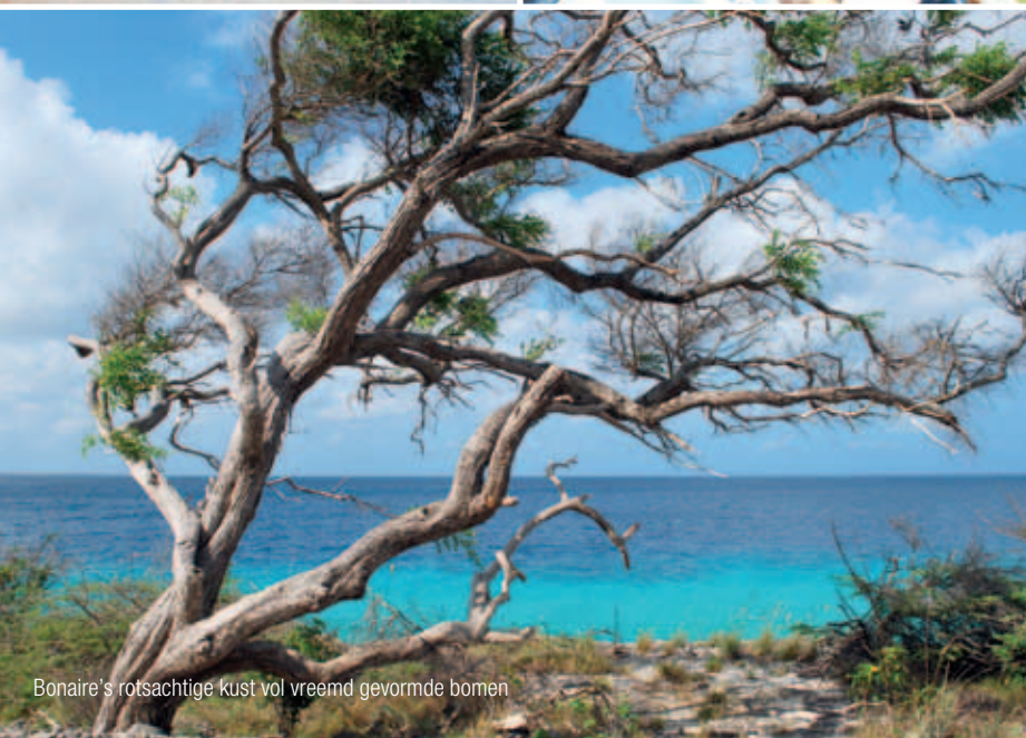
Bonaire's rotsachtige kust vol vreemd gevormde bomen