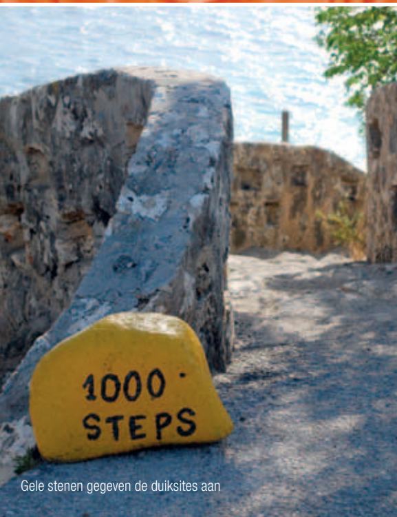
Gele stenen gegeven de duiksites aan