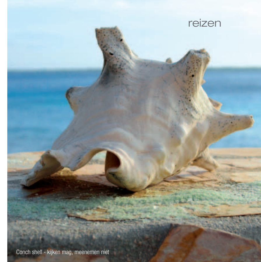
Conch shell - kijken mag, meenemen niet