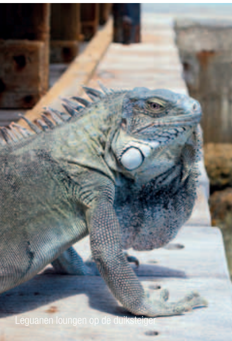
Leguanen lounen op de duiksteiger

Duiken of snorkelen is hier een kwestie van het kraakheldere water instappen; het rif begint waar het strand eindigt. Er zijn zo'n honderd duiksites, aangegeven met gele stenen met de naam: 1000 steps, Atlantis, Karpata. Ik ga in zee met Bonaire Dive and Adventure en na een duik op het huisrif varen we naar Klein Bonaire. Rond dit eilandje zijn nog meer prachtige duikplekken te vinden. Eigenlijk maakt het niets uit waar je te water gaat, het is overal even helder, vol kleurige vissen en omgeven door muren van koraal.