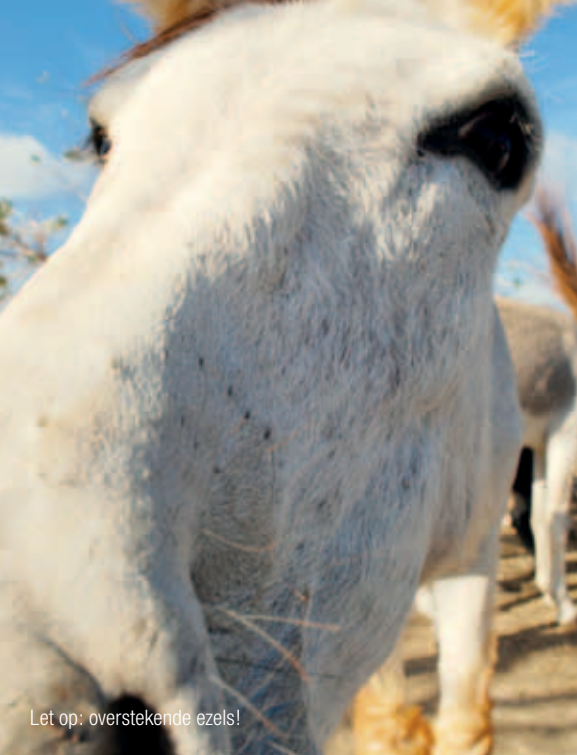
Let op: overstekende ezels!