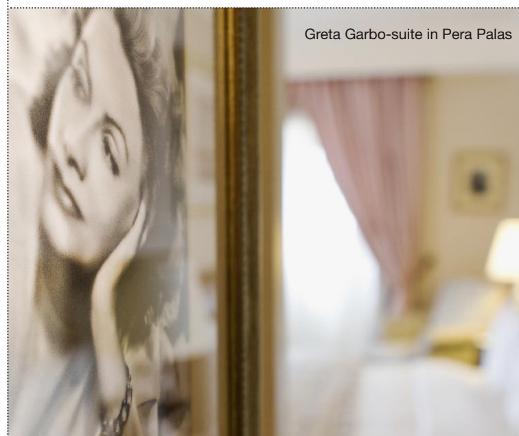
Greta Garbo-suite in Pera Palas