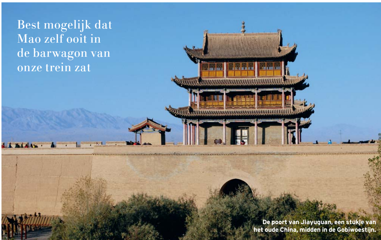
De poort van Jiayuguan, een stukje van het oude China, midden in de Gobiwoestijn.

Best mogelijk dat Mao zelf ooit in de barwagon van onze trein zat