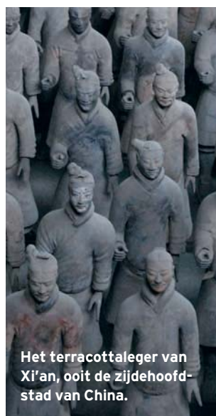
Het terracottaleger van Xi'an, ooit de zijdehoofdstad van China.