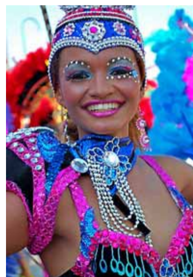
Voor zo'n stralende lach valt iedereen als een blok.