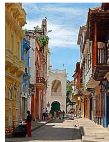
De kleurrijke oude binnenstad straalt vrolijkheid uit.

„Of je nu gaat voor strand, shoppen, cultuur of culinair genieten; Barcelona heeft het. Doe vooral wat de Catalanen doen en eet tussen 14.00 en 16.00 uur warm. Voor ongeveer een tientje heb je op veel plekken al een lunchmenu, inclusief drankje. Vissieliefhebbers moeten aanschuiven bij Big Fish in El Born, voor de mediterrane keuken ga je naar En Ville in El Raval. En, pas ontdekt: La Cucine Mandarosso, een fantastische Italiaan in El Born. Voor tapas zit je altijd goed bij de Cerveceria Catalana. Voor de sportieve toerist is de Carretera de les Aigües een aanrader, de oude waterweg met fantastische uitzicht over Barcelona. De begraafplaats Cementeri de Montjuïc is met haar pompeuze grafmonumenten en kitscherige grafnissen ook een bezoek waard. Loungen met uitzicht op zee doe je bij La Caseta del Migdia, achter het kasteel op de heuvel. En voor originele souvenirs slaag je zeker bij Wawas in El Born.“