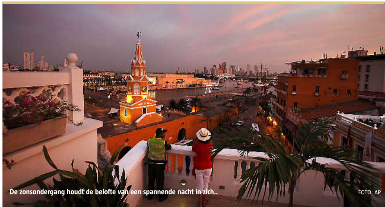
De zonsondergang houdt de belofte van een spannende nacht in zich...

HILLARY CLINTON WERD ONLANGS GEKIEKT TERWIJL ZE IN CARTAGENA, TIJDENS EEN TOPCONFERENTIE, TOT DIEP IN DE NACHT BIER DRONK EN DANSTE. Tijdens diezelfde top amuseerden twaalf beveiligingsagenten van Obama zich een beetje té veel, met alle gevolgen voor hun baan van dien. Cartagena - kronkelende straatjes, koloniale panden, schattige oude dametjes, flarden salsamuziek - weet (soms te goed) wat feesten is. Een paar minuten aan de Caribische kust van Colombia is genoeg om je vooroordelen over dit land acuut bij te stellen.