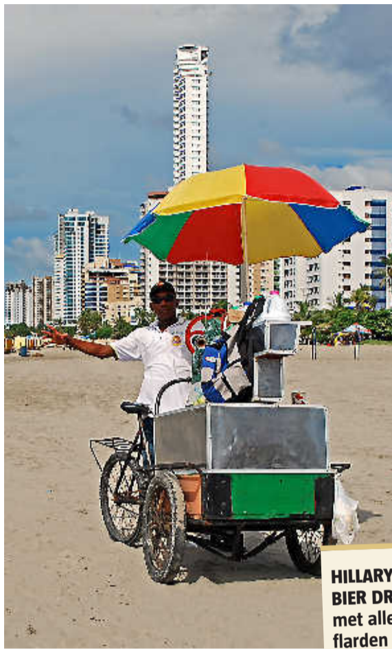
Op het strand wemelt het van de verkopers.